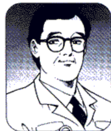
โทมิโอะ วาตะตอนหนุ่ม ภาพจากหนังสือการ์ตูนเรื่องเครื่องคิดเลขชาร์ป หน้าจอแบบผลึกเหลว LC เครื่องแรกของโลก