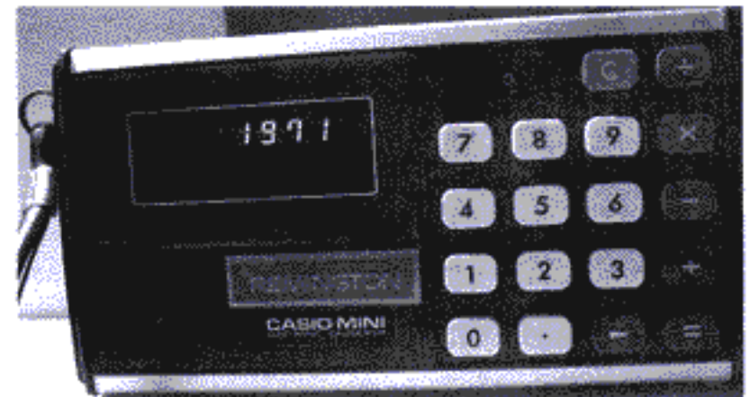
คาสิโอ มินิ ของบริษัท คาสิโอ

หลังจากนั้นไม่นานบริษัทชาร์ปได้พัฒนาเครื่องคิดเลขรุ่นใหม่ที่มีขนาดเล็กลง โดยเปลี่ยนจากการใช้ทรานซิสเตอร์และไดโอดมาเป็นการใช้วงจรรวม (ICs) ทำให้ทางบริษัทสามารถผลิตเครื่องคิดเลขตั้งโต๊ะรุ่น QT - 80 ที่มีขนาดเล็กลงออกมาจำหน่ายในปี ค.ศ. 1969 เครื่องคิดเลขรุ่นใหม่กว้าง 13.5 เซนติเมตร ยาว 24.7 เซนติเมตร สูง 7.2 เซนติเมตร มีน้ำหนัก 1.4 กิโลกรัม เครื่องนี้วางขายในราคา 99,800 เยน ระยะเวลาที่บริษัทคู่แข่งรายอื่นเริ่มผลิตเครื่องคิดเลขที่มีราคาถูกลงกว่าออกมาตีตลาดเครื่องคิดเลขชาร์ปอย่างบริษัทคาสิโอ (Casio) ก็ผลิตเครื่องคิดเลขรุ่นใหม่ออกวางขายในราคาเพียง 48,000 เยนเท่านั้น