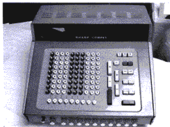
เครื่องคิดเลขชาร์ป CS - 10A ที่วางจำหน่ายเมื่อ ค.ศ. 1964

นอกจากจะต้องหาผลึกเหลวที่เหมาะสมแล้ว ทีมวิจัยยังมีเรื่องที่ต้องทำอีกมากมาย ไม่ว่าจะเป็นการออกแบบวงจรไฟฟ้า การหาสารยึดติดแผ่นกระจก ตลอดจนหาแหล่งพลังงานไฟฟ้าที่เหมาะสม เนื่องจากผลึกเหลวจะเกิดเป็นฟองขึ้นมาเมื่อผ่านไฟฟ้ากระแสตรง และลดทอนอายุการใช้งานของผลึกเหลวอย่างรวดเร็วด้วย แต่หากใช้ไฟฟ้ากระแสสลับ จะทำให้ผลึกเหลวมีปัญหาในการทำงานในสภาพแวดล้อมที่อุณหภูมิต่ำ และทำให้วงจรไฟฟ้ามีความซับซ้อนมาก