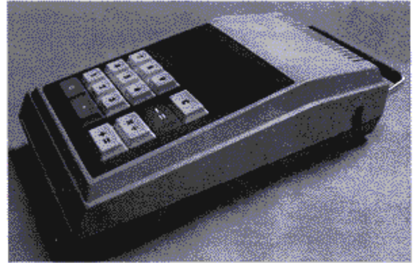
QT - 80 ของบริษัทชาร์ปจำหน่ายในปี ค.ศ. 1969

ย้อนกลับไปในปี ค.ศ. 1964 อันเป็นปีที่บริษัทชาร์ปผลิตเครื่องคิดเลขแบบตั้งโต๊ะรุ่น CS - 10A ออกมา เครื่องรุ่นนี้ถือเป็นเครื่องคิดเลขรุ่นแรกที่ชาร์ปผลิตออกวางจำหน่าย เครื่องคิดเลขในตอนนั้นประกอบด้วยทรานซิสเตอร์ และไดโอดเท่านั้น ตัวเครื่องก็ใหญ่เทอะทะมีขนาดกว้าง 42 เซนติเมตร ยาว 44 เซนติเมตร สูง 25 เซนติเมตร และหนักถึง 25 กิโลกรัม เครื่องคิดเลขรุ่นนี้จำหน่ายในราคา 535,000 เยน