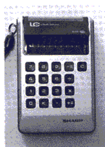
เครื่องคิดเลขชาร์ป EL-805 ที่ใช้หน้าจอลiquid crystal

แม้จะพบปัญหาและอุปสรรคมากมาย แต่ด้วยความทุ่มเทของทุกฝ่ายในทีม ท้ายที่สุดพวกเขาก็สามารถพัฒนาเครื่องคิดเลขขนาดพกพาสำเร็จก่อนกำหนด ทำให้บริษัทสามารถวางสายการผลิตสินค้าใหม่เสร็จก่อนเดือนเมษายน ปี ค.ศ. 1973