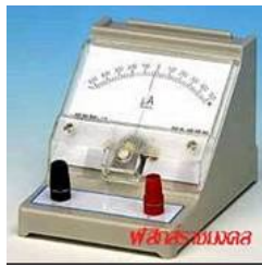
กัลวานอมิเตอร์ (Galvanometer)

หลักการของมิเตอร์ไฟฟ้า ได้มาจากการเหนี่ยวนำไฟฟ้า ซึ่งเราจะได้เห็นทิศทางการเคลื่อนที่ของไฟฟ้าที่เกิด