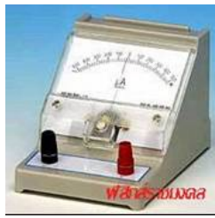
กัลวานอมิเตอร์ (Galvanometer)

หลักการของมิเตอร์ไฟฟ้า ได้มาจากการเหนี่ยวนำไฟฟ้า ซึ่งเราจะได้เห็นทิศทางการเคลื่อนที่ของไฟฟ้าที่เกิด